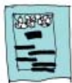
Comptine et illustrations

Voici quelques exemples de textes placés dans la même « justif » :