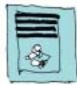
Fin d'un long conte et illustrations

Pour les albums, la mise en page la plus simple consiste en une illustration pleine page sur la page impaire, et le texte sur la page paire.