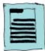
Début d'un long conte