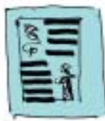
Conte en colonnes et illustrations